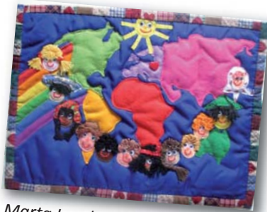
Marta Londzin (13, Poland): We Have Different Colours of Skin, But We Are All Children , 2007