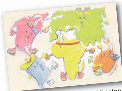
Svitlana Moskalenko (14, Ukraine): Merry Dancing , 2007