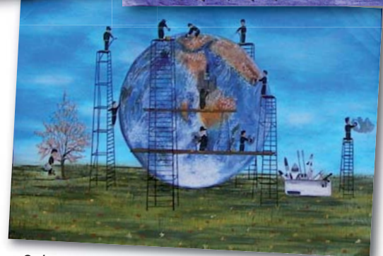
Saba Sameti (11, Iran): Save the Earth , 2001

Vielen Dank für Ihr Interesse. Wir freuen uns auf viele kreative Einsendungen!