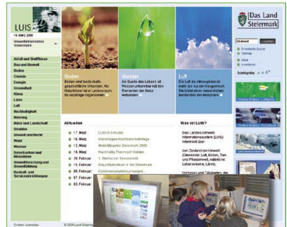
LUIS in Schulen

Seit mehr als 20 Jahren informiert das Land Steiermark aktiv im Rahmen der Landes-Umwelt-Information Steiermark (LUIS) über den Zustand der Umwelt (Gewässer, Luft, Boden, Tier- und Pflanzenwelt, natürliche Lebensräume, Lärm) sowie über Vorhaben und Tätigkeiten, die Gefahren für Menschen hervorrufen oder die Umwelt beeinträchtigen können. LUIS zählt heute zu den Portalen mit dem umfangreichsten Angebot an Umweltinformationen in Österreich.